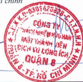
Đỗ Quốc Phong